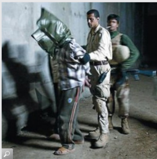
Un soldado iraquí y otro de EEUU escoltan a un prisionero encapuchado en una acción del 2008.