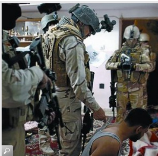
Una cámara filma una detención en Bagdad, en enero de este año, para constatar que el trato fue correcto durante la acción.

¿Cuánto vale la vida de un iraquí? Para el Ejército estadounidense prácticamente nada. Así se desprende de los documentos secretos divulgados por la organización Wikileaks. Un diario de la brutalidad banal ejercida por las fuerzas de ocupación estadounidense y también de los efectivos de seguridad iraquí, que estaban bajo su supervisión.